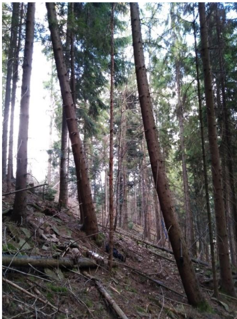
Fot. Drzewa pochylane na skutek osuwania